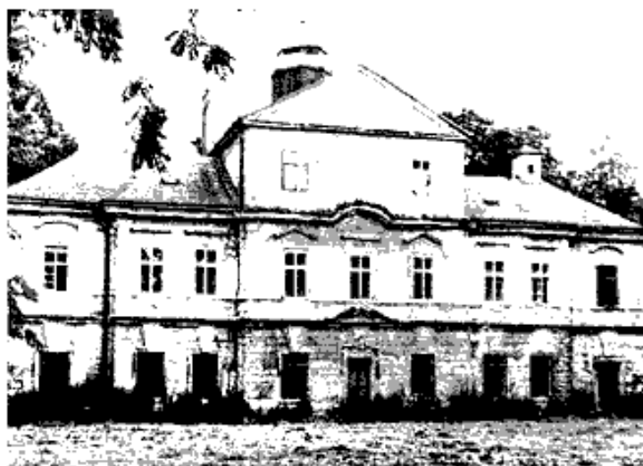
Barchovský zámek ještě stojící

10. září 1872 koupil zámek za 78 000 zlatých rakou-