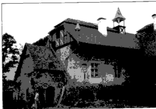
Tvrz Vlkošov - pohled na západní křídlo.

Mezi základem severního křídla tvrze a kamennou zídkou spojovanou na jíl jsou provedené důkladné jílové izolace, jednorázově zaplněné z hutné dusané vrstvy světlých jílu s rezavými a zelenými proplástkami, bez nálezů. Jde nejspíše o izolaci sklepních místností pod severním křídlem, které jsou cca o 2,5 m níže než dnešní nádvoří. Severní stěna zidky směrem k izolaci je nelicovaná. Těženo bylo do hloubky 150 cm, až pod dno objektu. Pak začala prolínat základem zdíva voda od objektu do jílu. Na dně objektu ležely druhotně použité kmeny, pod nimi propálená vrstvička jílu (vzorek pro dendrochronologickou analýzu odebrán z vrstvy 18 nad dnem objektu). Objekt cisterny(?) byl od jihu později devastován spadlými velkými kameny, tmavšími hlinitými vrstvami s bohatým keramickým materiálem a požárovou vrstvičkou (14. století). Poté byl objekt zaházen zelenošedým jílem, který je užit při budování valů prstence opevnění v letech 1470 - 1490. Povrch zasypaného objektu byl zpevněn velkými kameny. Další vrstva kamenů je již skutečnou dlažbou (renesanční úpravy) a přechází přes zídku z lomového kamene až ke stěně severního křídla. O cca 20 cm výše je kvalitní dlažba nádvoří z drobných oblázků, se svodovými žlábkami pro dešťovou vodu. Pod novodobými arkádami je dlažba značně poškozena.