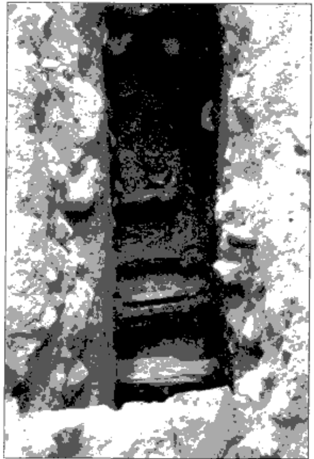
Tvrz Vikošov, sonda 4 - objekt patrně cisterny s dřevy