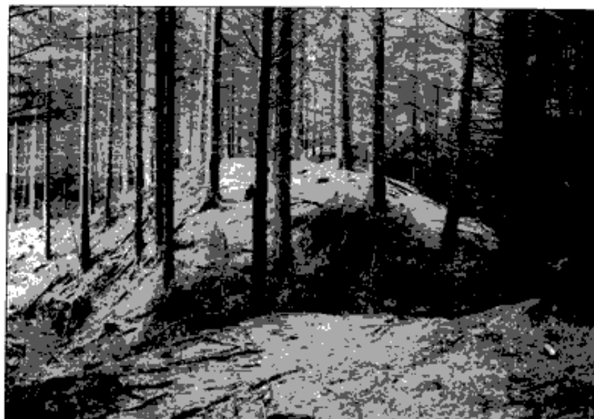
Těšov (okr. Cheb), boční bezpečnostní přeliv na mohutné hrázi považované mylně za druhý těšovský "ringval", vlevo druhotně protržení hráze, stav na jaře 2001

fortifikace by se zde nalézala ve velmi nevýhodné pozici "utopená" pod převyšujícím terénem. Až skoro při patě ostrožny se nachází terénní stupeň, který ji ze tří stran obklopuje, vzniklý evidentně lidskou činností. Nelze jej však zcela jednoznačně ztotožnit s obranným valem. Spíše by se mohlo jednat jen o bermu, nejpravděpodobnější je však vysvětlení, že jde o úpravu svahu pro poličko, ke kterému se od jihovýchodu přimyká zaniklá cesta stoupající podél východního svahu popisované ostrožny. Domníváme se, že ani zde nejspíše žádné sídlo či opevnění nestálo. Známost a velmi často diskutovanou lokalitou v Dolním Kramolíně jsou dva pahorky ve východní části vsi u čp. 32. 36) Avšak i zde s velkou pravděpodobností panské sídlo nestálo. Nezbyvá zde totiž nic jiného než souhlasit s tím, že se jedná o násyp hlušiny blízké stříbrné