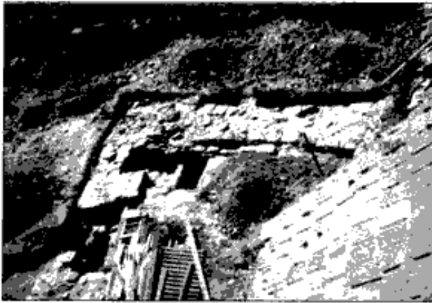
Tvrz Vikošov - odkryté gotické základy jihozápadního návoří

Dosud se předpokládalo, že tvrz vznikla až kolem roku 1450, ve stavbě užité architektonické detaily prvků ji řadí do pozdní gotiky až renesance. Archeologický výzkum přinesl pozitivní doklady, že tvrz tu existovala již ve 14. století, dendrochronologie zpřesnila dataci nalezených dřev již na rok 1324. Celá tvrz stojí mírně vyvýšena nad okolním terénem, nad ní na severu ji chránil rozlehlý rybník. V pozdní gotice bylo zdokonaleno opevnění o okruh jílového valu (z čistého šedého jílu) s vnějším příkopem.