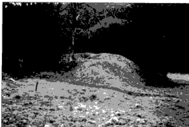
Wastlberg u Lázní (okr. Cheb), celkový pohled na pahorek od západu, stav na jaře 2001 před porušením objektu

Podle našeho názoru by se ve zkoumané oblasti měla další badatelská a výzkumná činnost včetně archeologických výzkumů věnovat zvláště dvěma "nadějným lokalitám" - pahorku v severní části Velké Louky a Wastlberku. V případě lokality na Velké louce se jedná o velmi pěkně zachovalý okrouhlý pahorek, u kterého jsme rádi za upozornění o jeho existenci z pera Z. Buchteleho. 64) Od cesty, která okolo něj na severovýchodě prochází, je oddělen pozůstatkem přikopu. Pahorek je dále obklopen bažinatým terénem, který vytváří břehy malého potůčku a přítomnost blízkého minerálního pramene. Neméně zajímavě působí i pahorek u Horních Lázní, zvaný podle starých map Wastlberg, objevený přímo Z. Buchtelem. 65) Zajímavou otázkou zůstává,