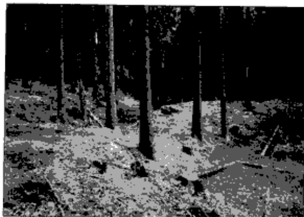
Těšov (okr. Cheb), ukázka bočního bezpečnostního přelivu na jedné z rybníčních hrází u Těšova, stav na podzim 2001

Zajímavá otázka vyvstává při lokalizaci panského sídla či sídel v nedalekém Dolním Kramolíně. 331 První možná fortifikace je kladena nad hluboký úvoz nad silnicí vedoucí od západu k obci. 341 Lze se s největší pravděpodobností domnívat, že terénní úpravy zachycené na starých mapách a částečně dodnes zachovalé souvisí pouze s kaplí, která zde stávala. Předpokládaný příkop a val je nejspíše jen pozůstatek cesty, která vedla pod kapličku a z které se na vlastní vyvýšeninu s kaplí vystupovalo zřejmě schůdky. Ostatně celý úvoz nese dodnes známky několika dalších zaniklých cest. Přibližně o 250 metrů západněji vybiehá nad zemědělskou usedlostí nevýrazná ostrožna, kterou od jihu výrazněji převyšuje mez a za ní zemědělsky obdělávaná plocha. Ostrožna se od meze výrazněji svažuje severním směrem. 351 Případná