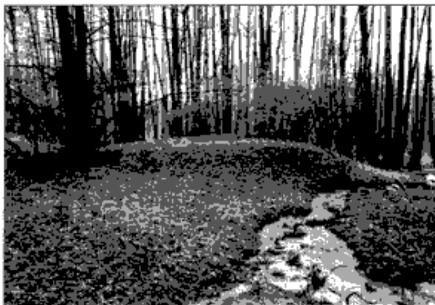
Velká louka u Kynžvartu (okr. Cheb), celkový pohled na okrouhlý pahorek při Jezevčím prameni, stav na podzim 2001, foto autoři

Přesuneme-li se v oblasti trochu více na sever, nemůžeme přehlédnout zmínku o zajímavé ostrožně u Podlesí, 551 která leží při ostré zatačce cesty stoupající pod Kamennou horu. Zde nám nezbyvá než víceméně souhlasit s interpretací zdejších terénních pozůstatků (přikop, terénní nerovnosti) jako pozůstatků zdejší rozsáhlé hornické činnosti. Avšak náznaky, že by se mohlo jednat (například v případě cesty, která obtáčí skoro celou ostrožnu) o zbytek přikopu, můžeme s velkou pravděpodobností vyloučit.